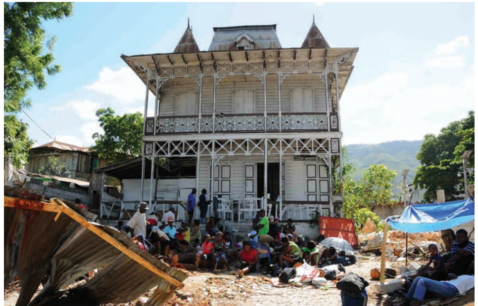
• Une maison gingerbread au quartier du Bois-Verna à Port-au-Prince, le 13 janvier 2010

Edifié au pied de l'impressionnante chaîne du Bonnet-à-l'Evêque, encaissé dans un site grandiose couvert d'une végétation luxuriante, le Palais de Sans-Souci a été conçu comme un vaste complexe administratif servant de fait de capitale au royaume. Le royaume d'Henry I er comprenait toute la partie nord du territoire nouvellement indépendant d'Haïti, convoité tant par la France, l'ancienne métropole de la Colonie de Saint-Domingue, que par la République d'Alexandre Pétion établie dans la partie sud d'Haïti. Le Grand