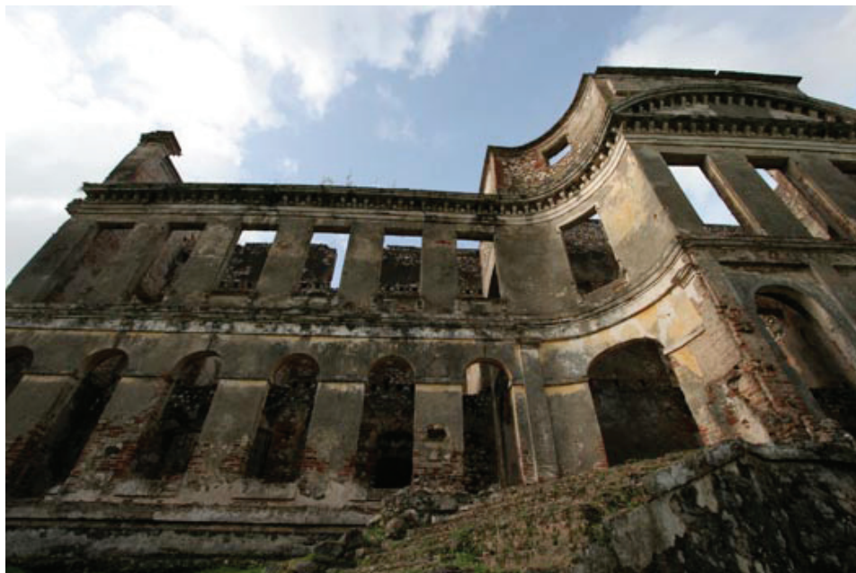
• Détail de la façade sud du Palais de Sans-Souci à Milot, Haïti

Les pertes énormes causés par séisme du 12 janvier 2011 aux biens culturels à Port-au-Prince (Voir le BI-9, 1 er février 2010) incitèrent la Fondasyon Konesans ak Libète (Fondation Connaissance et Liberté - FOKAL) à s'engager dans la lutte pour la sauvegarde de l'incalculable collection des maisons bourgeoises du XIX ème siècle de Port-au-Prince, communément appelée «maisons gingerbread ». En faisant appel à des nombreux experts internationaux dont ceux de la WMF, la FOKAL réalisa un recensement exhaustif des maisons gingerbread de Port-au-Prince tout