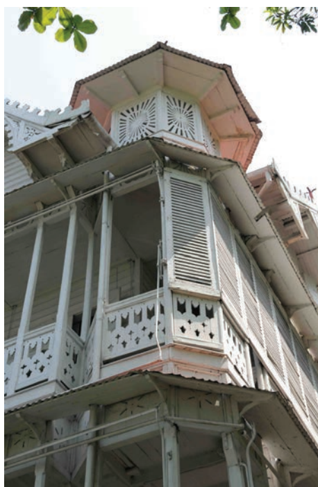
• La villa Keitel au quartier de Pacot à Port-au-Prince

Tous les deux ans, depuis 1996, le Fonds Mondial du Patrimoine ( The World Monument Fund - WMF ), organisation indépendante basée à New-York (E. U. A.) qui se dédie à la sauvegarde des monuments et des sites mondiaux les plus précieux, établit une liste