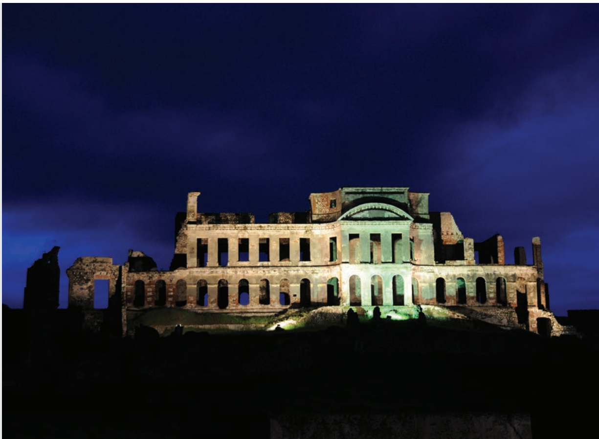
• Le Palais de Sans-Souci, à Milot, Haïti, illuminé